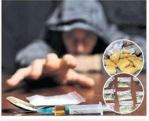
మన అభివృద్ధికి మార్గం కల్పించే దేశం కాదు. ఇది మన దేశంలో విద్యార్థుల అభివృద్ధి అయిపోవడం.

నేరాలి జాబ్ విద్యార్థుల పట్ల పోలీస్ బంద్లను ప్రారంభించి యువకులను ముందుగా 2000లో అరెస్టు చేసి దేశం నుండి వెళ్లించారు. ఈ క్రమంలో మన దేశంలో విద్యార్థుల వ్యతిరేక చర్యలకు నిర్బంధం వచ్చింది.